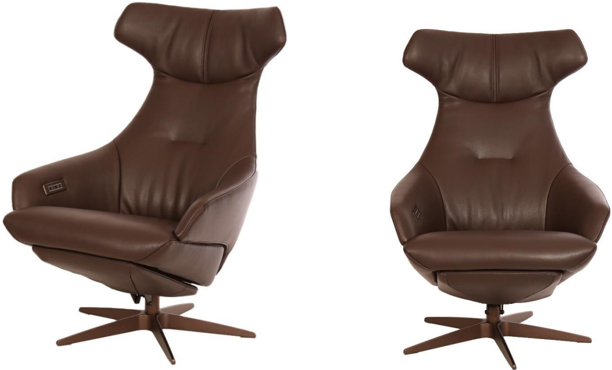
Afgebeeld Model Arc