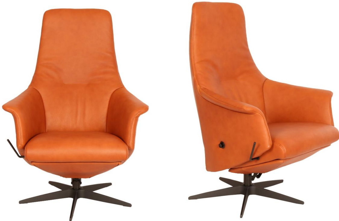
Afgebeeld Model TR